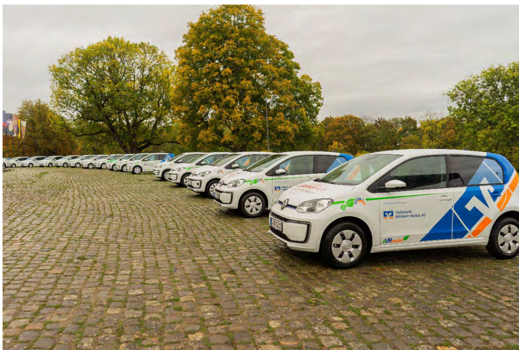
Auch die VRmobile (kurz für Mobile der Volksbanken und Raiffeisenbanken) der Gewinnsparevereine der Volksbanken und Raiffeisenbanken beklebt das Emders Foliererteam.