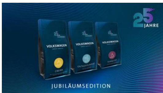
Der Jubiläumskaffee der Volkswagen Group Services.

Zwischen den einzelnen „Boxen“ lädt ein Sommergarten zum Verweilen ein. Zwischen liebevoll inszenierten Oldtimer-Bullis bietet das Gastronomie-Team der Volkswagen Group Services kulinarische Klassiker und moderne Alternativen: von der originalen Volkswagen Currywurst über vegane Alternativen bis hin zu Softeis.